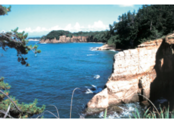
越前加賀海岸国定公園 (9,794ha) (越前加賀海岸国定公園)