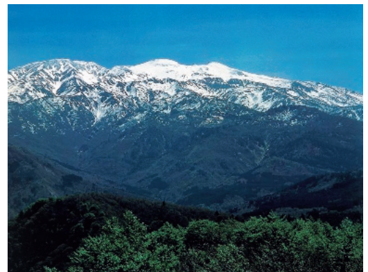
Haku-san National Park (49,900ha) (白山国立公園)