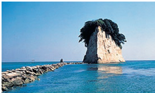
Noto Peninsula Quasi-National Park (9,672ha) (能登半島国立公園)