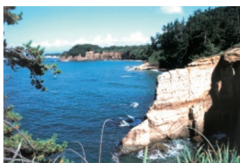
Echizen Kaga Coast Quasi-National Park (9,794ha) (越前加賀海岸国立公園)